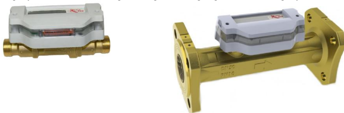
Рисунок 1 – Внешний вид расходомеров

Внешний вид расходомеров – счётчиков жидкости ультразвуковых КАРАТ-520 представлен на рисунке 1. Места пломбирования расходомера представлены на рисунке 2.